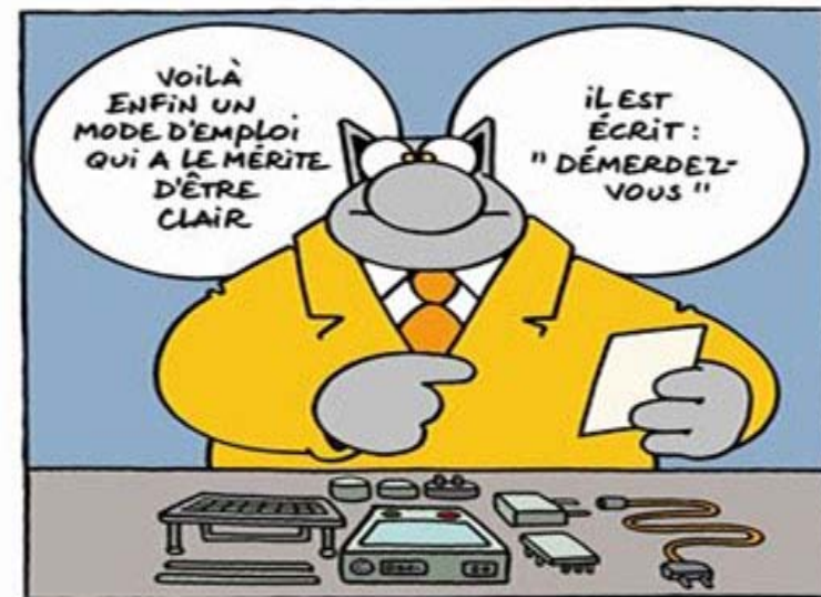
P. GELUCK, Le Chat